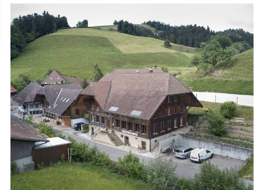
Museum in Heimisbach, Thal