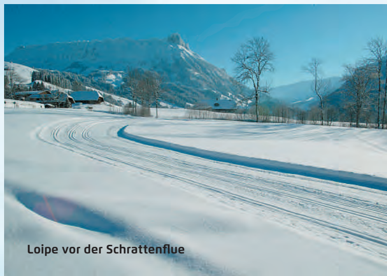
Loipe vor der Schratzenflue

Weitere Informationen unter: www.schneeschuhtrails.ch