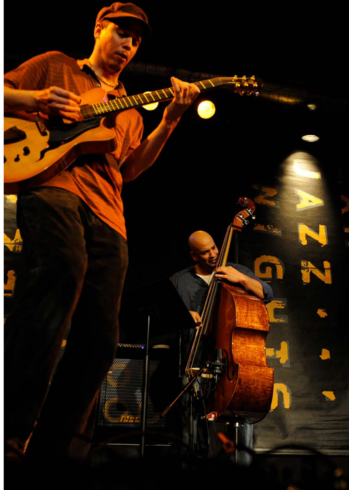
Bild rechts: Immer in der letzten Juli-Woche kommen die ganz Grossen ins Emmental: jazznights.ch