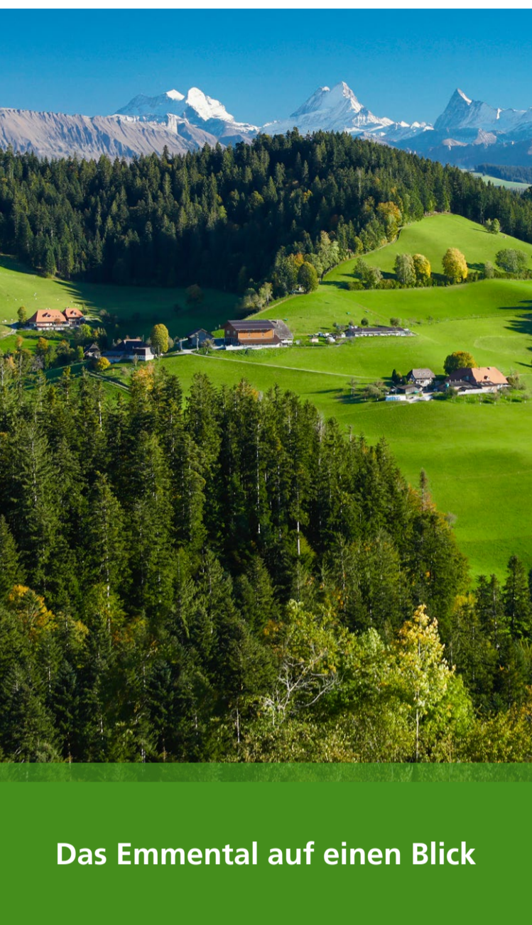
Das Emmental auf einen Blick

Willkommen in den Hügeln Eintauchen & geniessen