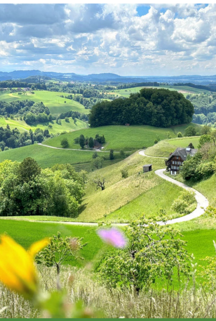
Das Emmental auf einen Blick

Willkommen in den Hügeln Eintauchen & geniessen